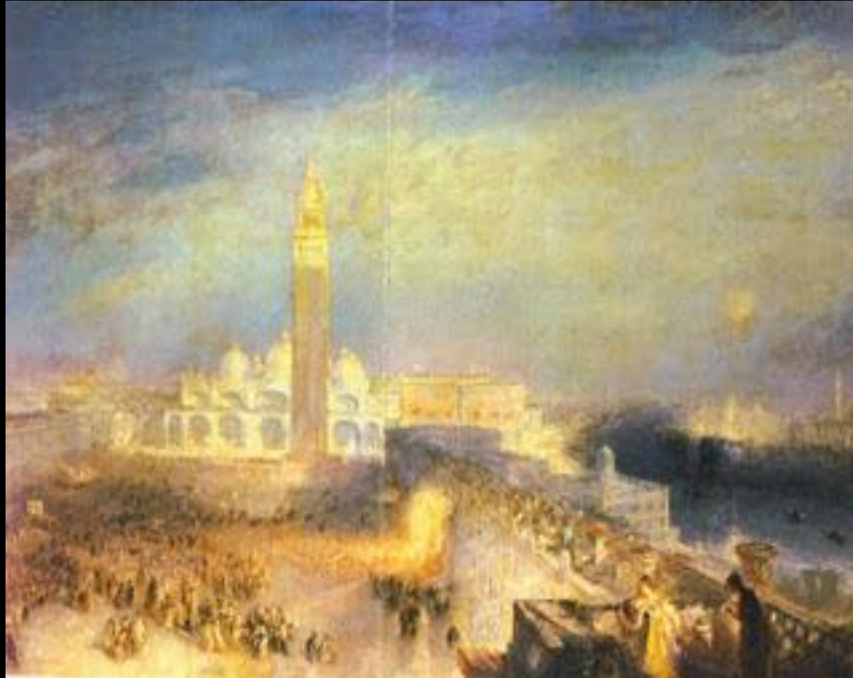
J. M. W. Turner, 'Juliet and her Nurse' (1836)