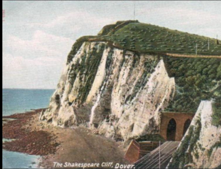
Shakespeare Cliff, Dover