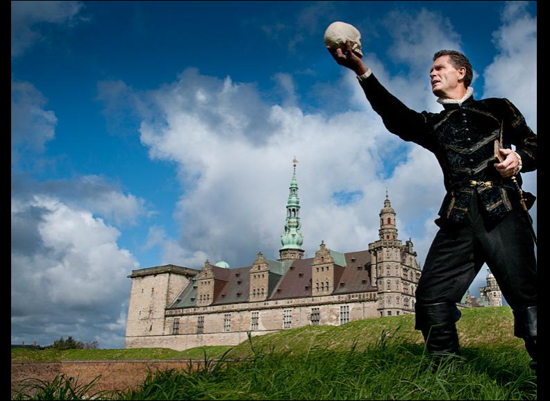
Helsingør, Schloss Kronborg