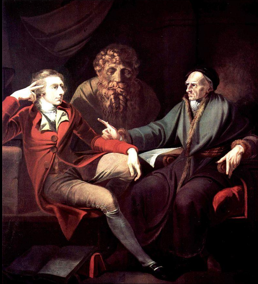
Johann Heinrich Füssli: Füssli im Gespräch mit Johann Jakob Bodmer (1780?)