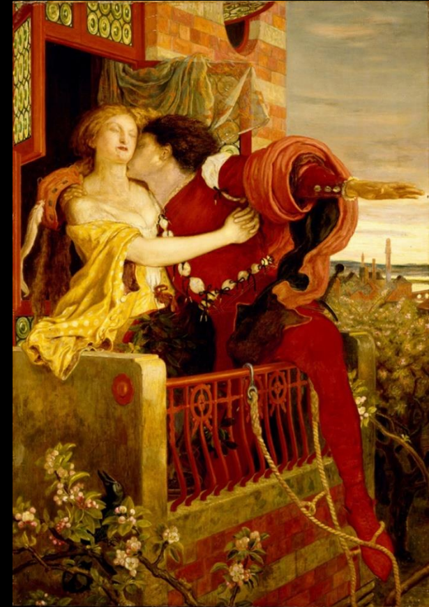
Fredrick Leighton, 'The reconciliation of the Montagues and Capulets over the dead bodies of Romeo and Juliet' (1854)--Ford Madox Brown, 'Romeo and Juliet parting on the balcony in Act III (1870)